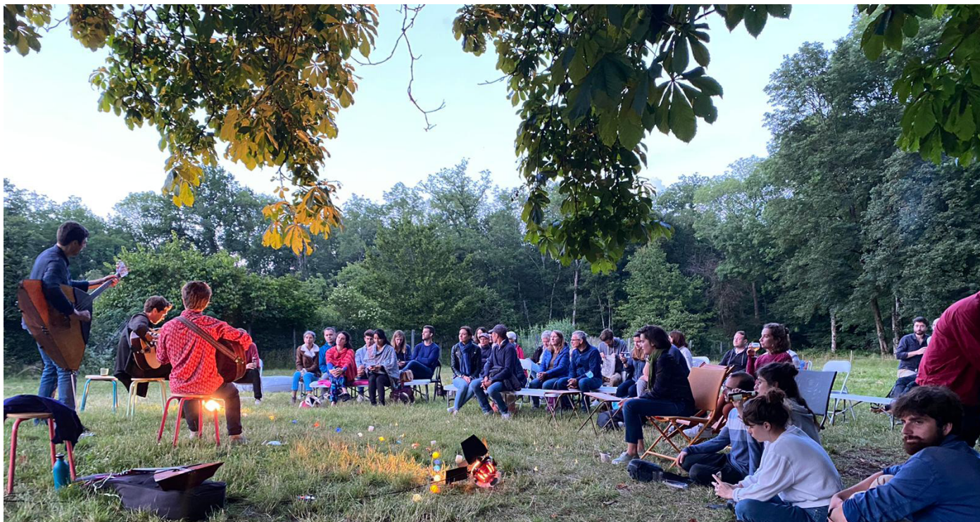
La cour des contes, Rambouillet

Ce massif emblématique de l'Île-de-France est particulièrement mis à l'honneur cette année dans le cadre des Nuits des Forêts, grâce à la participation de plusieurs acteurs institutionnels, artistiques et culturels du territoire. Une programmation qui ravira petits et grands, mélangeant forestiers, artistes et naturalistes, pour vous évader, pour poser un nouveau regard sur cette forêt bien connue des franciliens, et pour vivre des moments conviviaux, de jour comme de nuit !