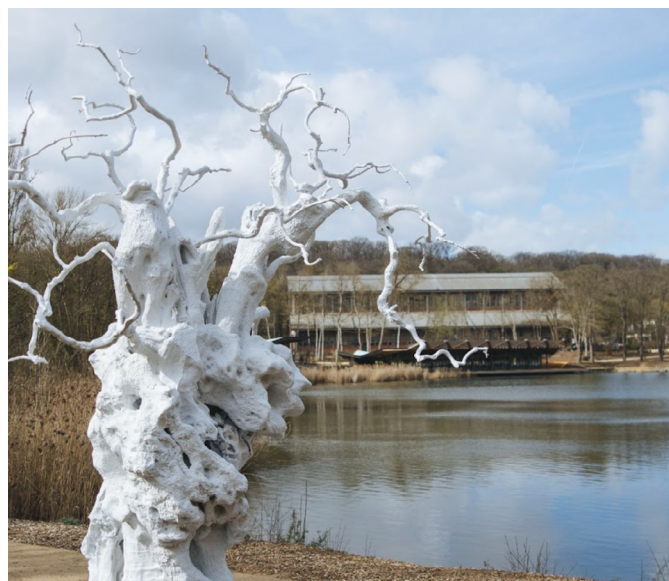
Hangar Y ©

Cette année, le Parc naturel régional du Vexin, la commune de Marines et l'entreprise Atmosylva s'associent pour vous faire découvrir les buttes de Marines. Cet Espace Naturel Sensible riche en biodiversité sera présenté au cours d'une balade forestière. Puis deux chasses au trésor seront organisées avant de clôturer cette journée par un léger concert acoustique.