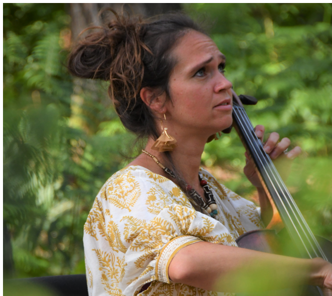
Forêt de Fontainebleau

À l'occasion des Nuits des Forêts, l'auteur et ancien entrepreneur du monde de la nuit Romain Dian propose un "Appel de la forêt" avec la Greenline Foundation : une expérience unique sur deux jours, en pleine immersion dans la forêt et ses bienfaits, avec une nuit en bivouac. Événement payant.