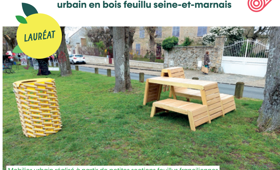
Mobilier urbain réalisé à partir de petites sections feuillus franciliennes

Trilport est une commune de 5 000 habitants située à l'est de Meaux dans le Nord de la Seine-et-Marne. Elle possède un riche patrimoine naturel grâce aux bords de Marne, aux coteaux agricoles et à la présence d'une forêt domaniale de près de 600 ha dont plus de la moitié sur son territoire.