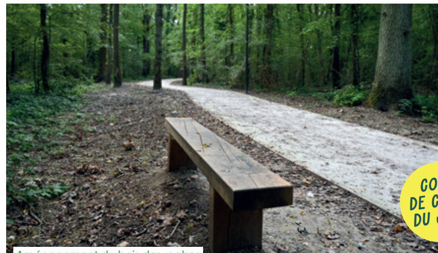
Aménagement du bois des roches