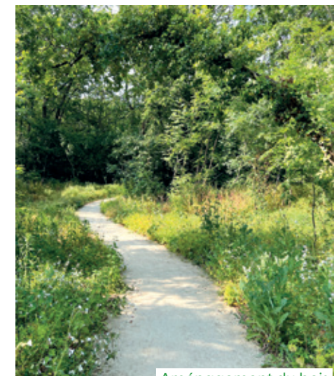
Aménagement du bois

Les aménagements conduits par la CA Val Parisis ont été conçus pour permettre une fréquentation respectueuse de l'environnement floristique et faunistique.