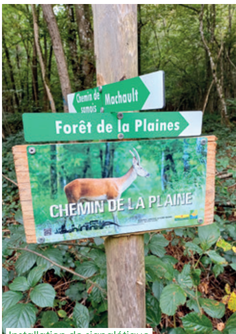
Installation de signalétique en forêt communale

Les panneaux ont été réalisés à l'aide de photographies animalières prises par un photographe du territoire. Les cheminements ont été dotés de noms afin d'aider les riverains à se repérer.