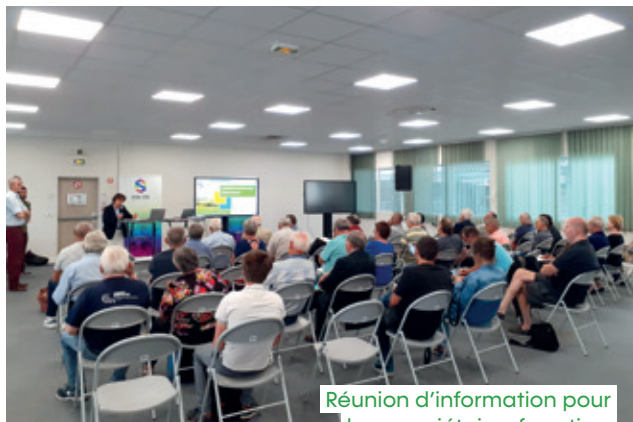
Réunion d'information pour les propriétaires forestiers

À terme, la communauté urbaine souhaite proposer une animation sur plusieurs années pour l'ensemble des forêts de son territoire afin d'augmenter de façon conséquente et durable le nombre de parcelles avec un document de gestion durable et de faire prendre conscience aux collectivités du potentiel présent sur le territoire.