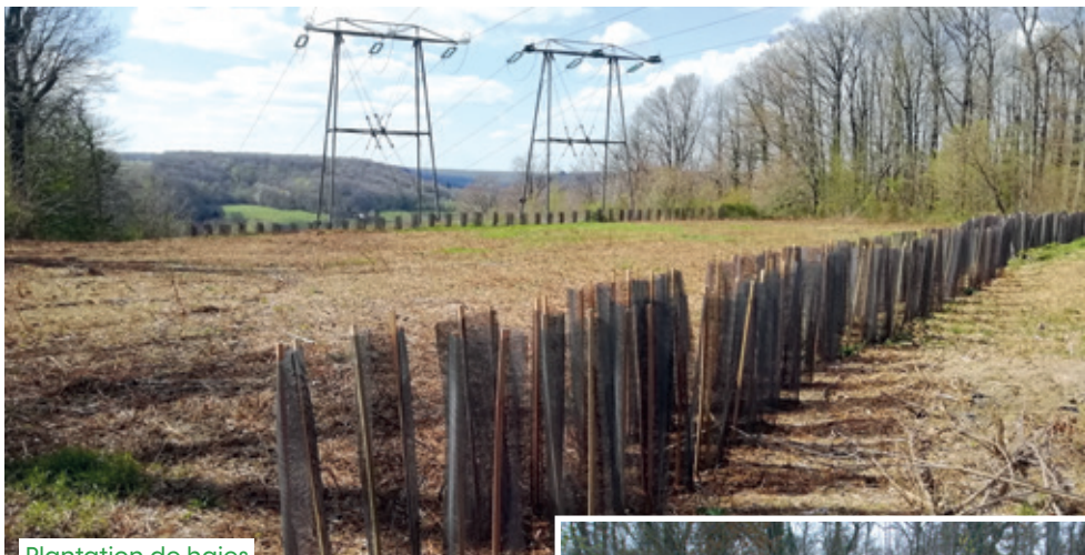
Plantation de haies

Situé à l'ouest de Paris, dans la grande couronne de la Région Île-de-France, le département des Yvelines est composé de 85 % d'espaces naturels et agricoles et offre de ce fait une grande variété de paysages abritant un patrimoine exceptionnel.