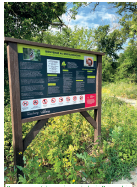
Panneau pédagogique du bois Barrachin

À l'intérieur du bois, deux types de cheminements permettent la circulation : l'un accessible aux personnes à mobilité réduite et l'autre sur un parcours sportif. Des espaces de repos et des panneaux pédagogiques ont été installés pour sensibiliser les habitants à la fragilité et à la richesse écologique des milieux. Un îlot de sénescence d'une surface d'environ 1 ha a été créé pour conserver les arbres dépérissant et préserver la faune liée au bois mort. Des nichoirs ont été posés pour favoriser la présence aviaire.