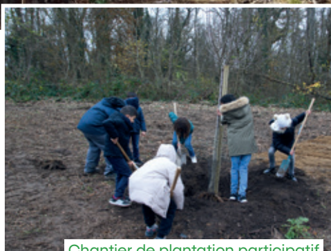
Chantier de plantation participatif

Ce projet présente le partenariat entre RTE, le gestionnaire du réseau public de transport d'électricité haute tension en France métropolitaine, et le Département des Yvelines (signé début 2022 pour 3 ans) dont l'objet principal est de valoriser les espaces sous et aux abords des emprises des lignes électriques traversant des forêts départementales dans le but d'assurer une amélioration de la biodiversité tout en contribuant à l'entretien sécuritaire sous ces emprises. Le projet concerne 6 forêts départementales traversées par des lignes à haute ou moyenne tension, elles sont toutes des Espaces Naturels Sensibles (ENS). Les premiers travaux ont débuté en 2022 et 2023 et se poursuivront en 2024, ils concernent des plantations de haies champêtres, de vergers et de strates arbustives, la création de mares, la coupe de bois pour la mise en place de lisière étagée, ou encore de