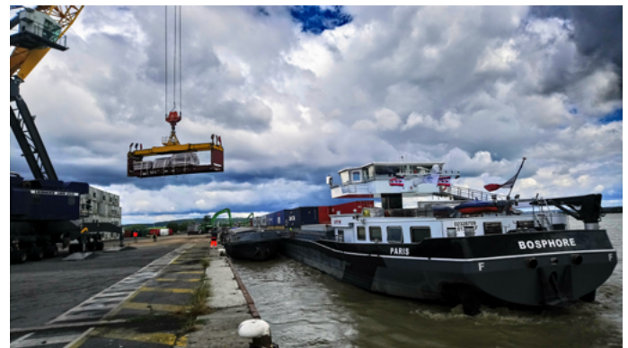
Déchargement d'un conteneur flat-rack depuis le Bosphore

Ces deux déchargements, permettront d'échanger avec les parties prenantes de cette initiative et bénéficier de leurs témoignages. Voies navigables de France, HAROPA PORT et