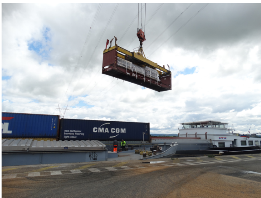
Déchargement d'un conteneur flat-rack depuis le Bosphore